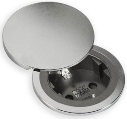
Abdeckungssatz CIP 8000 115